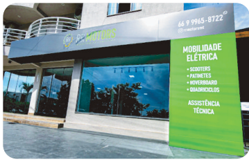
RRMOTORS Mobilidade elétrica