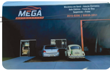
Mega Auto Center