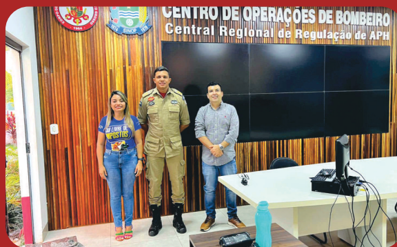
Encontro na sede do 4º Batalhão de Bombeiros Militar