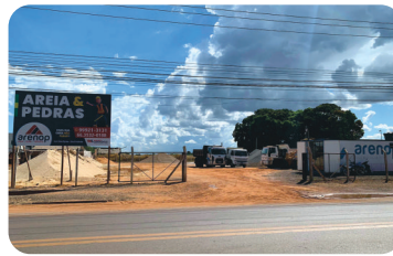
Arenop Areia, Pedra e Pedrisco