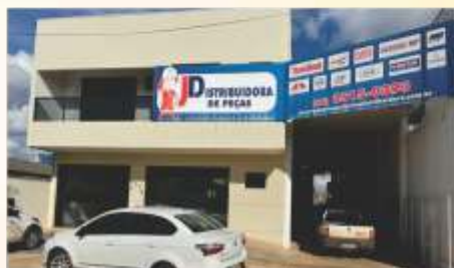
Jd Distribuidora de Peças