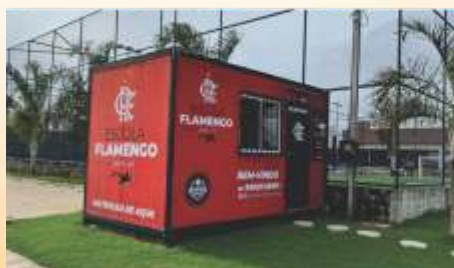
Escolinha do Flamengo