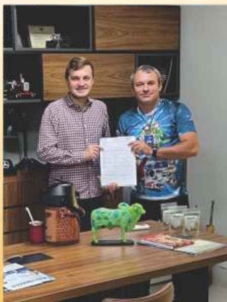
R. Prante Transpostes