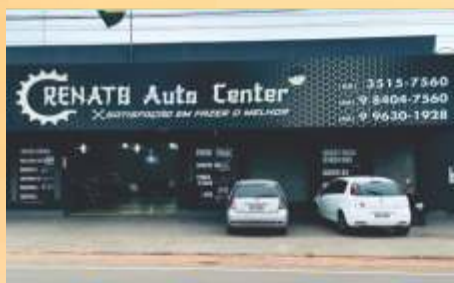
Renato Auto Center