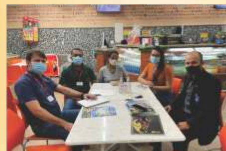
CDL com Colaboradores do Atacado