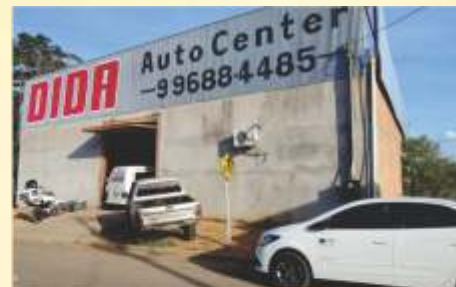
Dida Auto Center