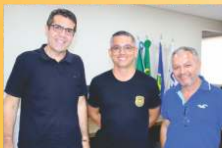
Polícia Civil CDL Parceria