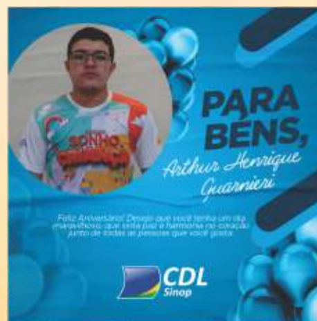
Aniversariante do Mês