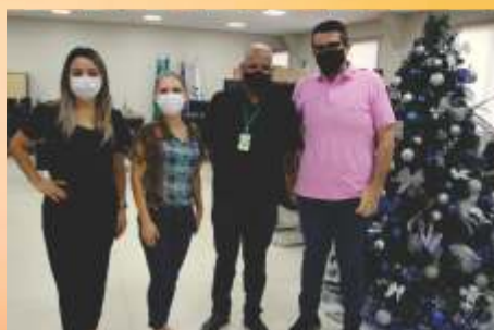
Sec. Ass. Social Parceria CDL