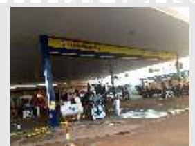
Posto Tominaga II