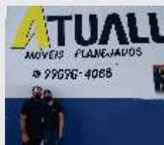
Atual MÓVIES Planejados