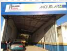
Auto Elétrica Alemão