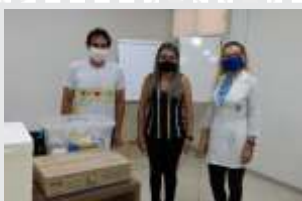
CDL Vacina toda equipe contra a gripe

CDL Sinop cuidando da segurança sanitária da equipe, com álcool 70%, máscaras e medindo a temperatura.