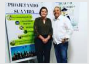
Projetando sua Vida