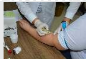
CDL Realiza exame de coronavírus em toda equipe.