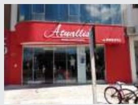
Atualis Sibipirunas 2815