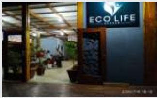
Eco Life Garden

Todos os dias novas empresas assinam filiação na CDL Sinop aproveitando nossos serviços e produtos com o melhor custo benefício. Conheça alguns de nossos filiados.