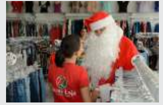
Equipe CDL levou o Papai Noel para visitar comerciantes e clientes na Julio Campos