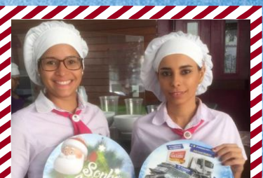
Império do Açaí