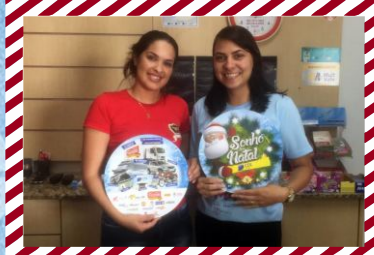
Empório Da Carne