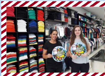
Teen Malhas Malwee