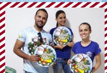
Casa do Construtor