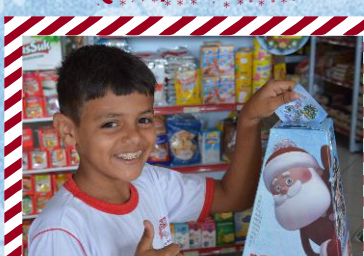
Mercado Brasbol Roma