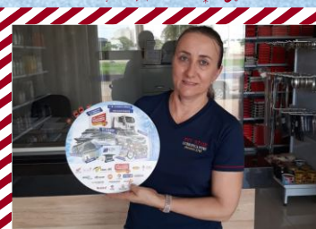
Pit Stop Lubrificantes