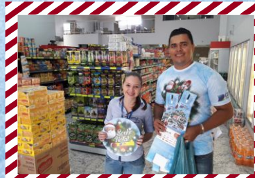
Supermercado Campos Novos