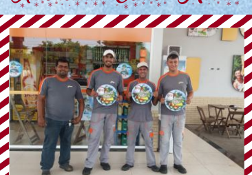
Posto dos Ipês