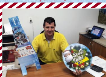
CFB Conquista Autoescola