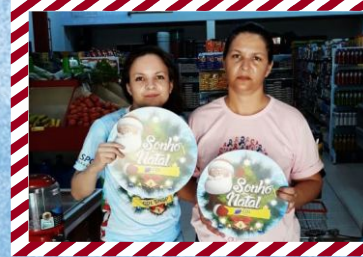
Mercado Terra Rica