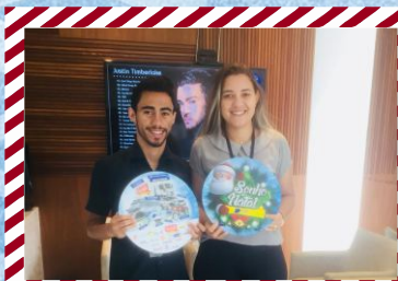
Ótica Mato Grosso