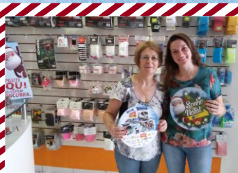
Bola ao Ar