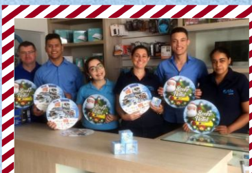
Casa do Micro