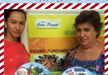
Colégio Jean Piaget