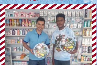
Drogaria Sempre Mais