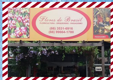
Flores do Brasil