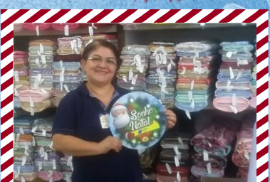
Rei do Pano