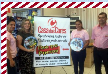
Casa das Cores