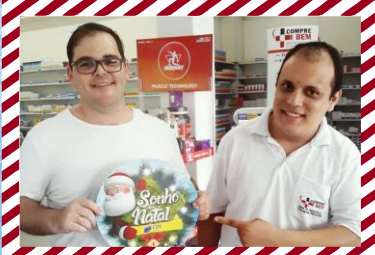
Drogeria Compre Bem