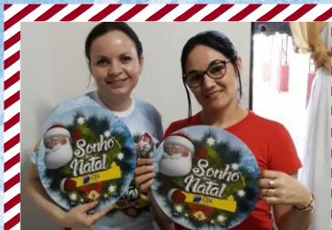
Baterias e Auto Elétrica Saturno