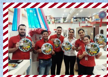
Martinello Super Center