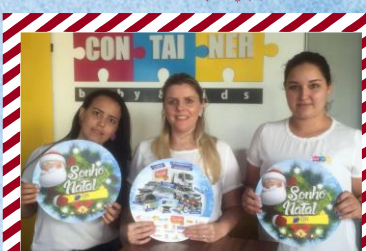
Container Baby & Kids