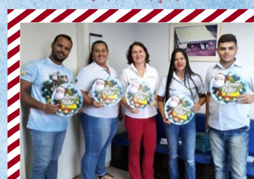
Recapadora de Pneus Sinop