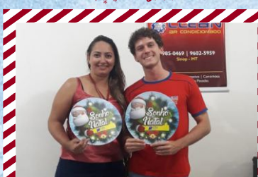
Clean Ar Condicionado