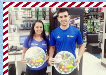
Palácio dos Esportes