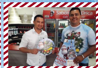
Sabores da Drica