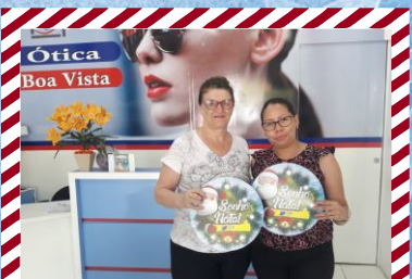
Ótica Boa Vista