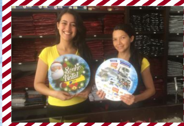
Sol da Terra Nova Evangélica