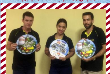
Líder Ar Condicionado