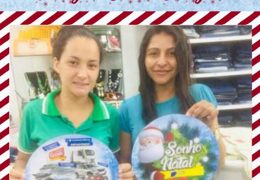
Americanas Center Modas