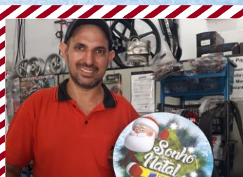
Casa das Motos