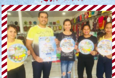
Lojão da Fábrica