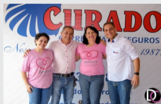
Rede Feminina prepara tradicional Feijoada.