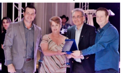
Homenagem ao Ex Pres. Alcides Raiter