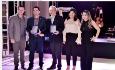
Homenagem à FCDL e CDL Cuiabá