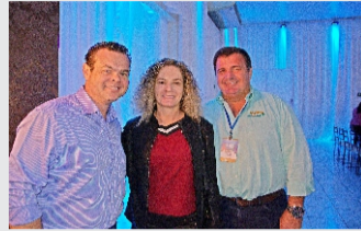
CDL apoiou e prestigiou o novo evento da Acrinorte.