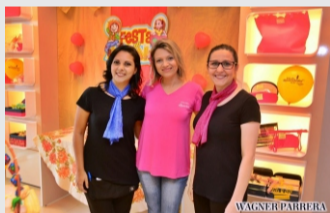
Realiza arraiá para recepcionar clientes.