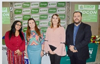
CDL prestigiou a 26ª Reunião Técnica dos Procons de Mato Grosso.