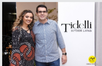
Apresenta novos produtos e tendências.