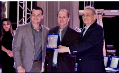
Homenagem ao Ex Pres. Luciano Chitolina