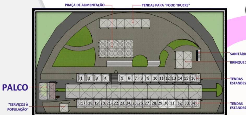
PLANTA BAIXA LAYOUT Sem escala