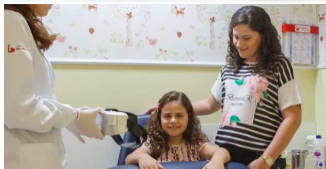
O Lojista | CDL - Sinop

O segundo equipamento é um óculos de realidade virtual feito especialmente para as crianças, que assistem uma animação 3D, ficando entretida com os desenhos interativos