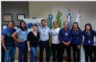
Equipe CDL passou por treinamento para melhor atender o associado.