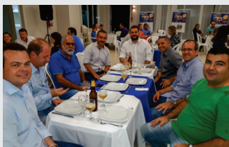
CDL reuniu os patrocinadores da campanha de Natal 2017 em agradecimento pela parceria.