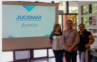
Equipe CDL passou por treinamento conhecendo o novo sistema da JUCEMAT.