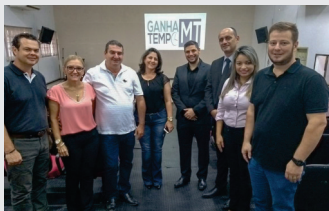
CDL definiu seu posicionamento dentro do prédio do Ganha Tempo que deve ser inaugurado em Março.