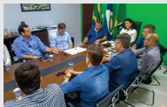
CDL se reúne com prefeita, vereadores e entidades para tratarem sobre lei que está defasada e começará a ser cumprida.