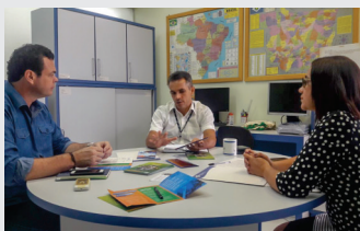
CDL esteve reunida com o Sebrae reafirmando a parceria entre as entidades para o ano de 2018