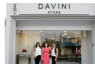
CDL prestigiou inauguração da nova loja