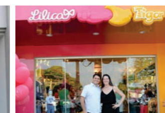
CDL desejou sucesso na nova empresa de Sinop