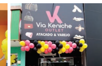
CDL deu as boas vindas a nova filiada