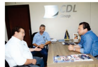
Presidente da entidade visitou a CDL para falar sobre a Exponop