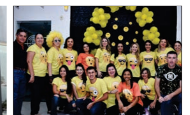
CDL parabenizou a escola pelo evento Let's Smile