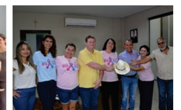
CDL repassou para Refeecs, chapéu do cantor para leilão beneficente