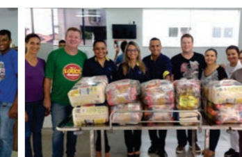
CDL colaborou com cestas básicas para os colaboradores do Hospital que estão com salários atrasados