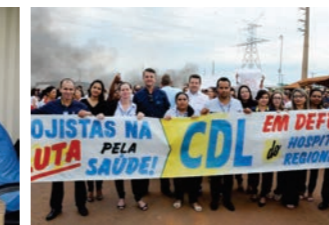
CDL participou das reuniões e do protesto em defesa dos colaboradores do Hospital Regional