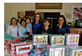
CDL fez doação de doces para o dia das crianças da instituição