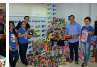
Mais de 200 brinquedos foram arrecadados para o natal