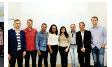
CDL Sinop participou do treinamento realizado em Cuiabá pelo Conselho Estadual do SPC de Mato Grosso