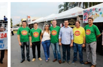
CDL apoiou o evento realizado pela ACES